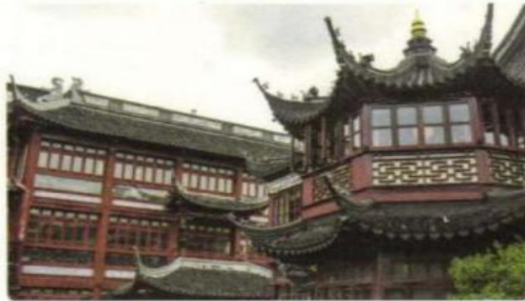
中国建筑中的飞檐

汉代以后，中国的许多建筑逐渐把屋檐做成微微向两侧升高的形状，特别是屋角部分明显地翘起，给人以翼角如飞的感觉。这样既可以使阳光充分照入室内，使雨水借抛物线流向远处，又具有审美价值。这一类带有人的精神意向的事物一经人类的实践活动创造出来，便以实体的形式独立于人的意识之外。