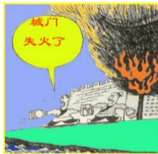
城门失火，殃及池鱼